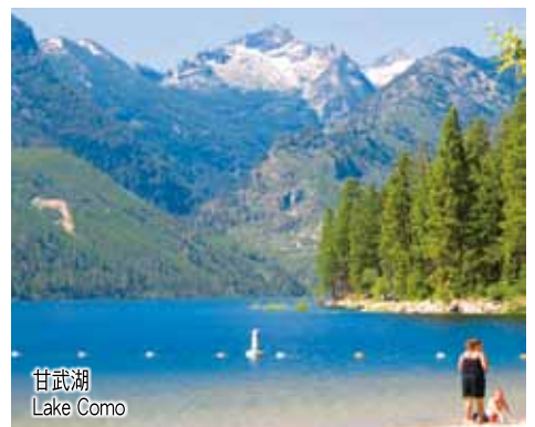
甘武湖 Lake Como

住宿：Holiday Inn Hotel 或同級 (早、晚餐) Coach to Venice. On board a water taxi to St. Mark's Square, all will have a spectacular view of the Bridge of Signs, the Basilica, etc., and will enjoy a demonstration in a glass blowing factory. In late afternoon, a memorable visit to Verona, the home of Shakespeare's star-crossed lovers. A brief stop for all to admire the Roman Arena and Juliet's Balcony.(B/D)