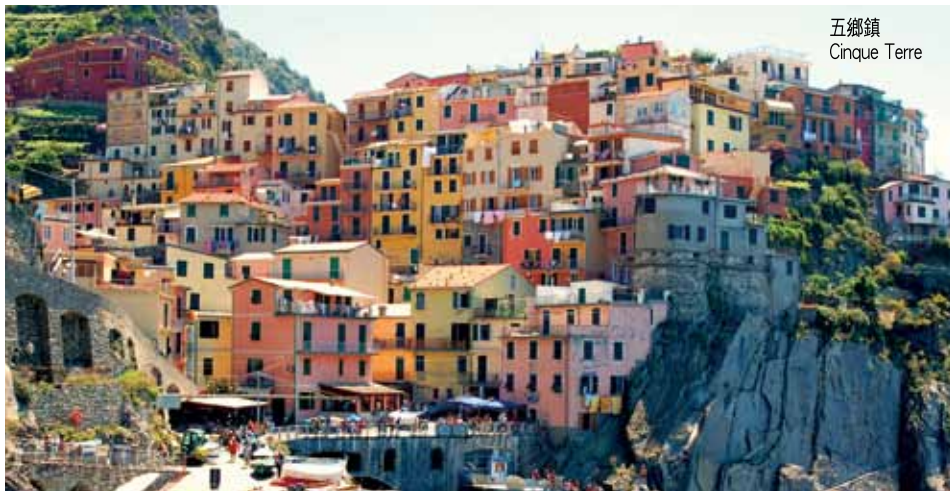
五鄉鎮 Cinque Terre