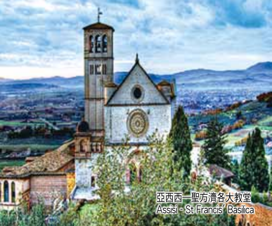
亞西西—聖方濟各大教堂 Assisi - St. Francis' Basilica