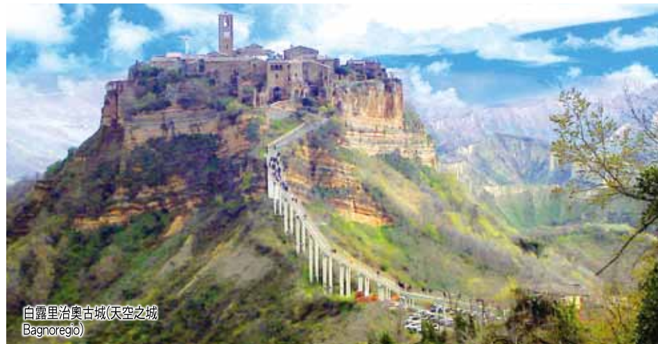
白露里治奧古城(天空之城) Bagnoregio)