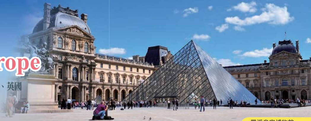
羅浮皇宮博物館 Louvre Museum

暢遊：法國、盧森堡、德國、荷蘭、比利時、英國 Visiting: France, Luxembourg, Germany, Netherlands, Belgium, England