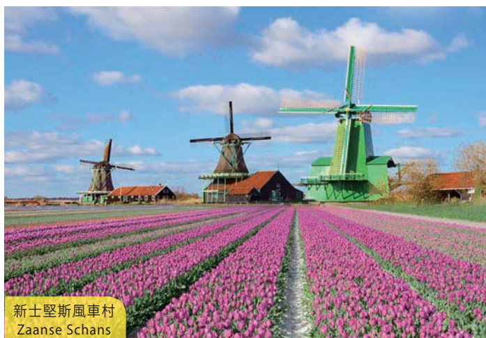
新士堅斯風車村 Zaanse Schans

Coach to Brussels. Situated between France and the Netherlands, Belgium encompasses all the best that Europe has to offer. Admire the architecture dotting the cobblestone squares. Photographing the Grand Place, Manneken Pis, etc. is a "must". On board the Euro Star train, all arrive London in late afternoon. (B/D)