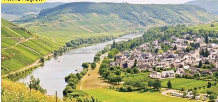
萊茵河區 Rhine Region