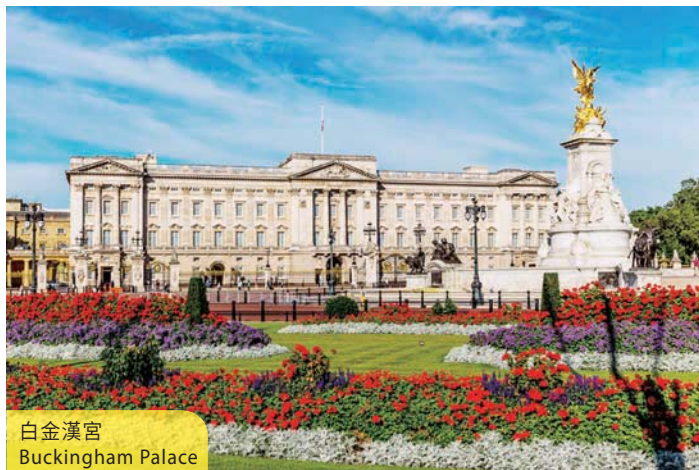
白金漢宮 Buckingham Palace

Upon arrival, all will visit the famous Louvre Museum to appreciate the immortal painting of Mona Lisa. Next stop is the Montmartre Hill, known for the white-domed "Vincent Van Gogh". This is followed by an optional cruise on River Seine, which is highly recommended as another way to discover Paris. A French banquet dinner will be a unique experience for all. (D)