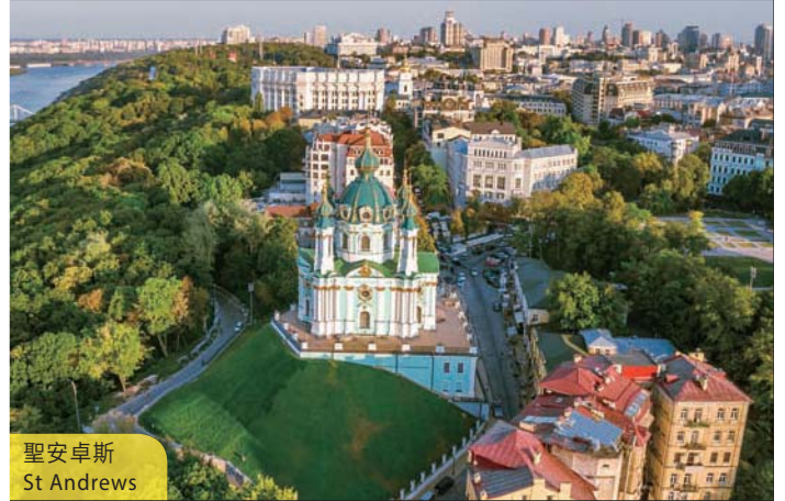
聖安卓斯 St Andrews

It starts off with a stop at Stonehenge where there are gigantic boulders, the formation of which still remains an intriguing mystery. After witnessing the world's rare architectural remains, coach to the City of Bath, renowned for its Roman relics. (B/D)