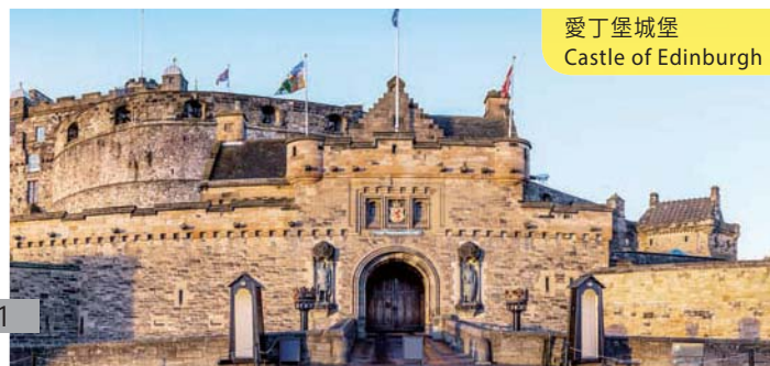
愛丁堡城堡 Castle of Edinburgh

Coach to Manchester to visit the world famous Manchester United stadium "Old Trafford". A wide array of exhibits, including trophies won over the years is on display. In the afternoon, proceed to Leeds for dinner at a local restaurant. (B/D)