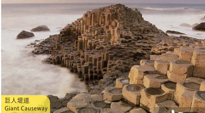
巨人堤道 Giant Causeway