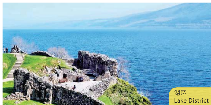
湖區 Lake District

Coach to Oxford and tour around the individual colleges. The Christchurch College is the best known college, because it was where the movie "Harry Potter" was filmed. Then, shopping at Bicester Village. Next attraction is a visit to Stratford-upon-Avon, where Shakespeare, the literary maestro, was born. (B/D)