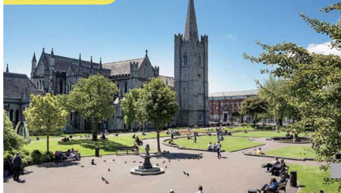
聖帕翠克大教堂 St. Patrick's Cathedral

自助式早餐。驅車往巨人堤道。它的形成是由約六千萬年前地底噴出岩漿，所造成奇特的海濱景觀，堤道大約由四萬支柱狀，玄武岩構成。其中 The Glens of Antrim 是野生動物和各種花草並茂的棲息地，尤其是格連納瑞芙享有“ 幽谷之后 ”的美譽。午餐自