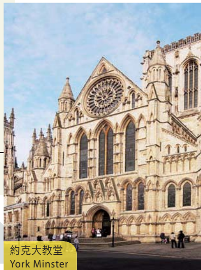
約克大教堂 York Minster