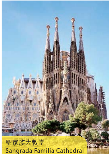
聖家族大教堂 Sagrada Familia Cathedral