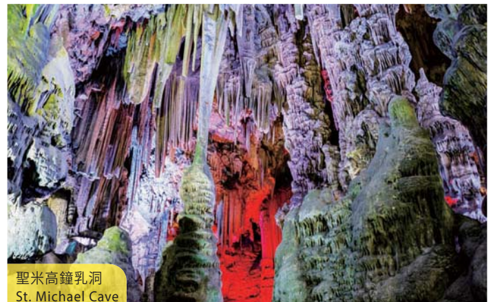
聖米高鐘乳洞 St. Michael Cave

住宿：太陽海岸區 Gran Costa Del Sol Hotel 或同級 (早、晚餐) Head south for Gibraltar. Upon arrival, transfer to the city center to visit St. Michael Cave. Later on, proceed along the coastal line to Costa Del Sol, the famous beach resort south of Spain, with a brief stop at Mijas, known as "White Mountain City". Houses there are painted in white, composing a picturesque view for photos. (B/D)