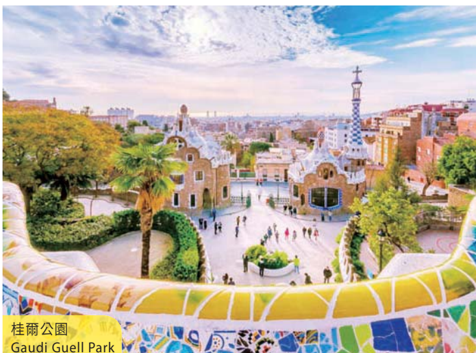
桂爾公園 Gaudi Guell Park

Coach to Seville, Spain, via the longest bridge in Europe, Vasco Da Gamma. The afternoon tour includes the Cathedral with its bell tower, Maria Luisa park, Spanish Square, etc. In the evening, an optional choice to enjoy the Flamingo Dance show is available. (B/D)