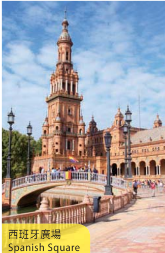
西班牙廣場 Spanish Square

A visit to the Portugal Royal City before proceeding to Fatima to visit the Holy Shrine, scene of celebrated religious miracles. Later on, a brief stop at Cabo Da Roce on the way to Cascais, a famous fishing village at the outskirts of Lisbon. (B/D)