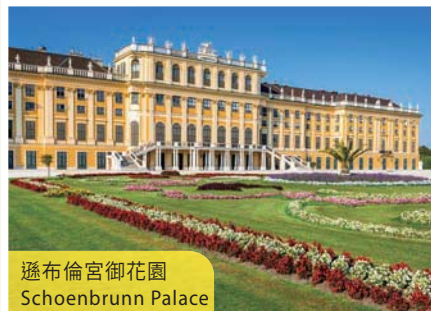
遜布倫宮御花園 Schoenbrunn Palace