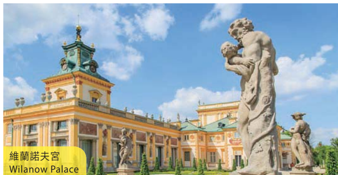
維蘭諾夫宮 Wilanow Palace

住宿：Novotel Hotel 或同級 (早、晚餐) The historic centre, severely devastated during World War II has been re-built. All will see the site of the Warsaw Ghetto, St Joseph's Cathedral, Mermaid, St Cross Church, Barbakan, etc. The Wilanow Palace, will be the next unique attraction for the afternoon. Typical Polish Apple Duck dinner is served. (B/D)