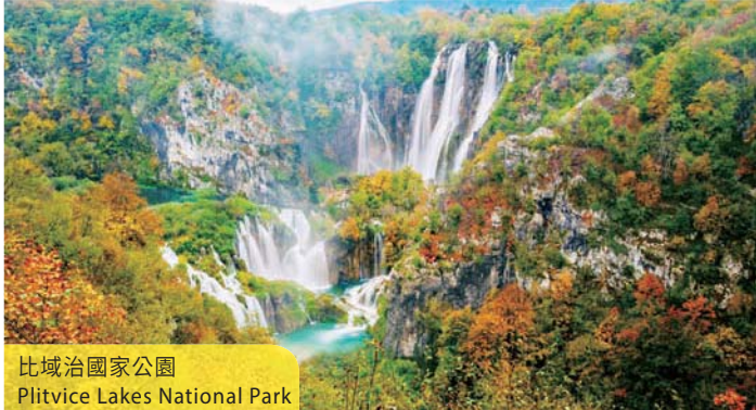
比域治國家公園 Plitvice Lakes National Park