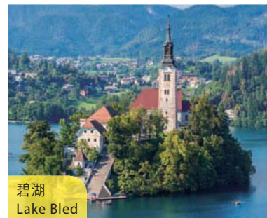
碧湖 Lake Bled