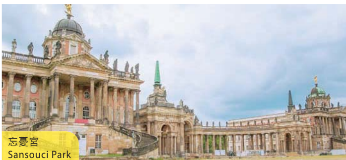
忘憂宮 Sansouci Park

住宿：Estrel Hotel 或同級 (早、晚餐) Coach to Potsdam where the famous treaty among Russia, USA and UK was signed in the Second World War. Stops will be made at Lake Wannsee and Cecilienhof, as well as Sansouci Park, renowned for the magnificent flowered terraces. Later on return to the city to visit the Berlin Wall, Tiergarten, German State Opera House, Riechstag Building, Charlie Checkpoint, etc. Typical dinner with German beefsteak and beer will be served. (B/D)