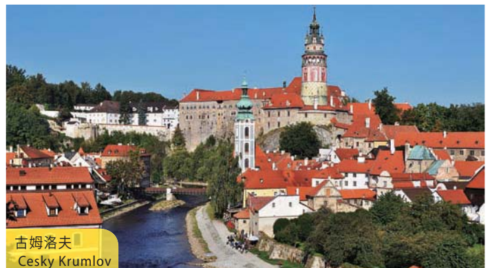
古姆洛夫 Cesky Krumlov

City tour includes the Hradcany Castle, formerly the King's home, now the residence of the President. Later, proceed to the St. Vito Cathedral and finally to the Old Town, Town Hall and the renowned Charles Bridge. Afternoon will be free at Leisure. Typical dinner with mixed meat and dark beer will be served.(B/D)